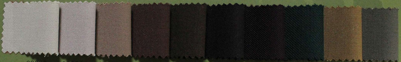
00000 00000 00000 00000 00000 00000 00000 00000 00000 00000 var. 62A var. 608 var. 622 var. 66T var. 640 var. 649 var. 361 var. 735 var. 260 var. 702