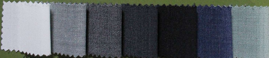
00000 00001 00001 00001 00001 00001 00001 var. 000 var. 804 var. 80R var. 044 var. 062 var. 517 var. 70L